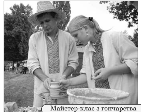
Майстер-клас з гончарства