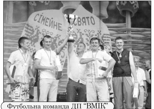
Футбольна команда ДП «ВМІК»