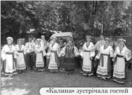
«Калина» зустрічала гостей