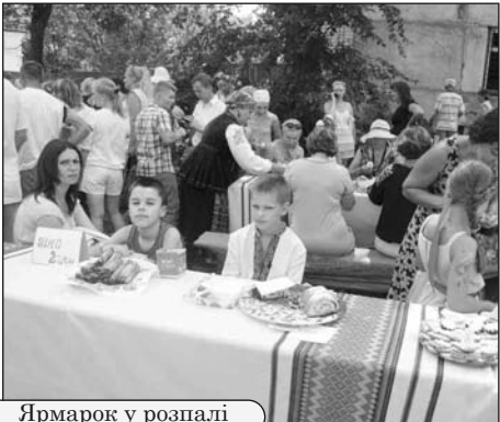
Ярмарок у розпалі

За традицією, дійство розпочалося зі змагання футболістів, у запеклій боротьбі цього спекотного дня перемогу та кубок Сімейного свята виборола команда ДП «ВМІК». З 12-ї почали працювати дитячі атракціони та майстер-класи з плетіння вінків, боді-арту, ткацтва, виготовлення