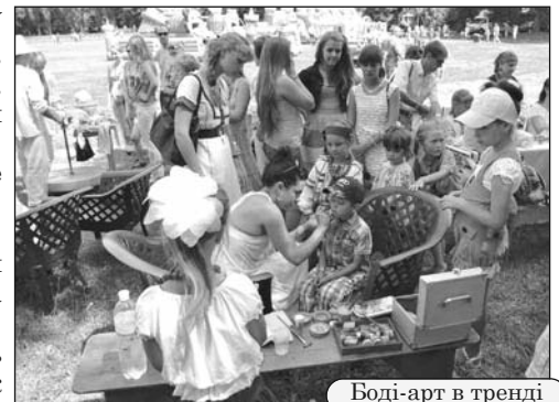
Боді-арт в тренді