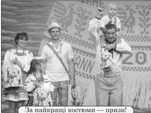
За найкращі костюми — призи!